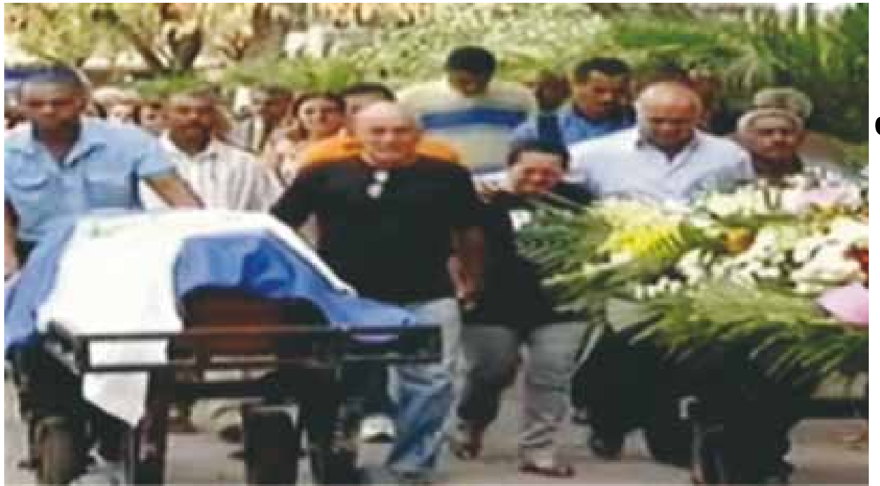
Dois vigilantes mortos e três pessoas feridas a assalto no Shopping Vitória